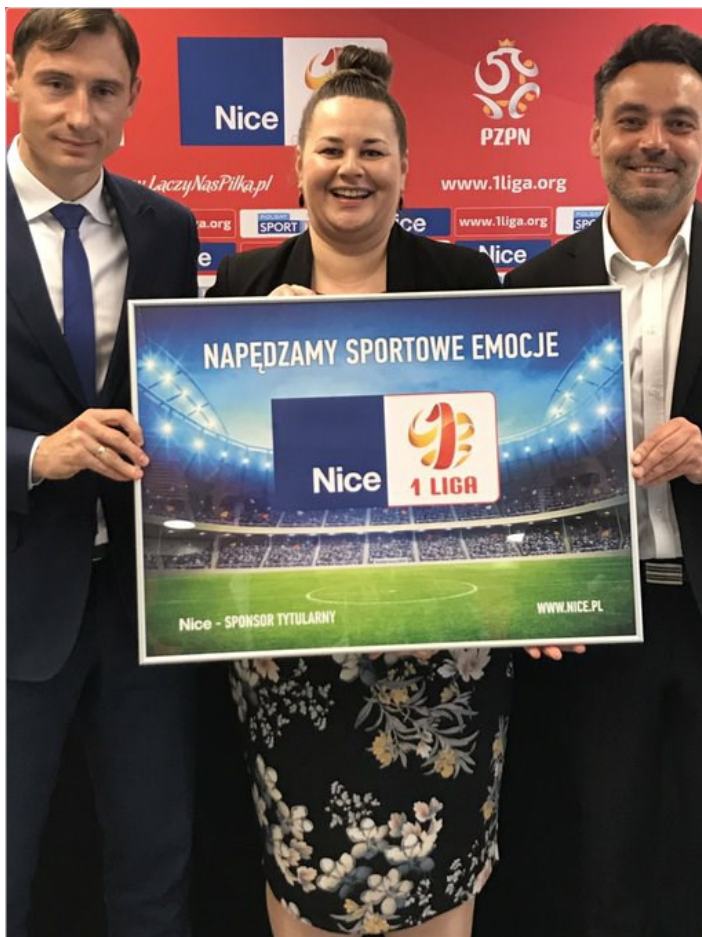
Zbigniew Boniek @BoniekZibi